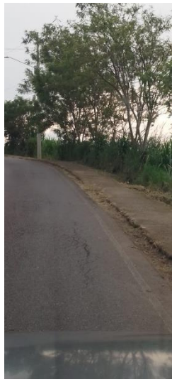
2 3. Chapea acera Santa Elena-La Victoria