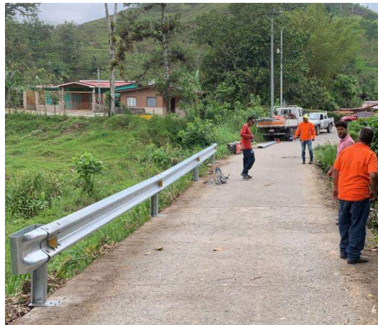
Puente sobre Rio Gato (Flex beam)