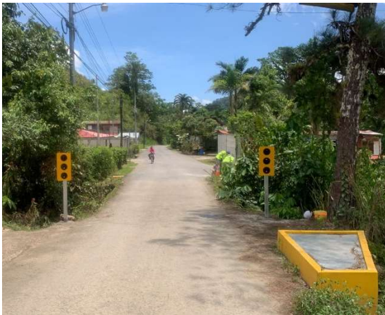
Puente La Marta