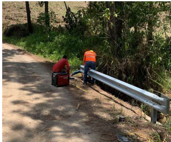
Camino la 26 (Flex beam)

5 4. Limpieza manual de drenajes en los siguientes caminos.