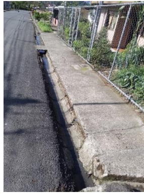
1 8. Limpieza manual Pejibaye Centro, Puente Bailley