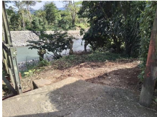
2 9. Limpieza manual Pejibaye Centro, Doña Fina