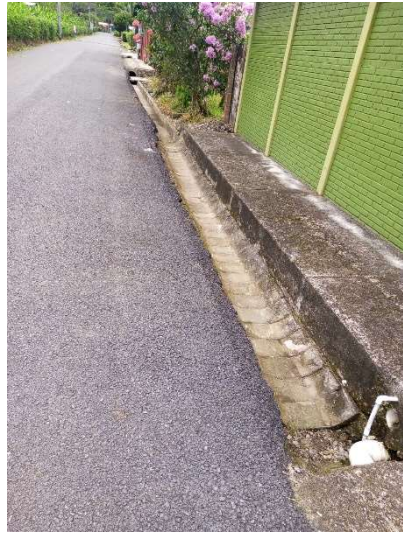
1 • Pejibaye-Los Tigres