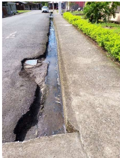
3 • Pejibaye Sector Doña Fina