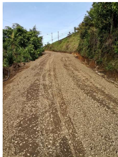
Después de la intervención