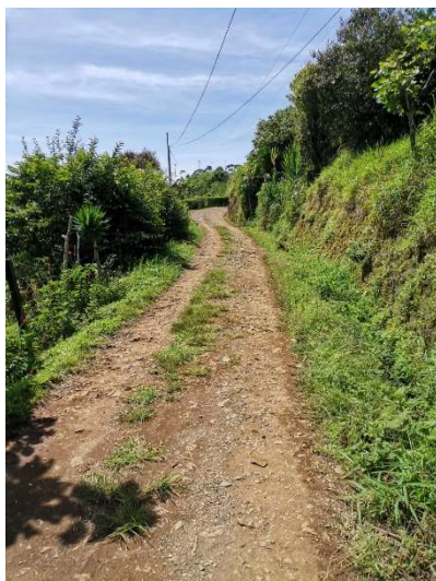
Antes de la intervención